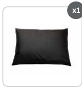
Funda almohada Earthing®