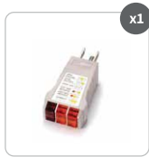
Tester de puesta a tierra