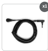
Cable en espiral