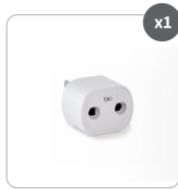
Conector de seguridad de doble puerto Earthing®