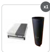
Un mat Earthing®