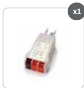
Tester de puesta a tierra