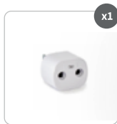
Conector de seguridad de doble puerto Earthing®