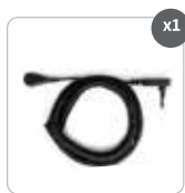
Cable en espiral